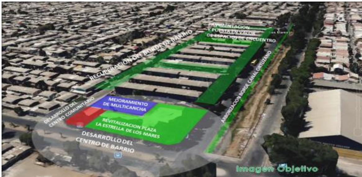
Imagen Objetivo del barrio